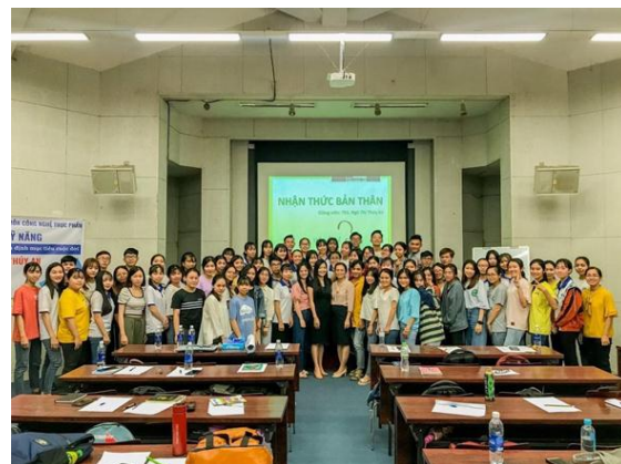
Sinh viên tham gia hoạt động ngoại khóa và huấn luyện kỹ năng

Các hoạt động ngoại khóa, hoạt động cộng đồng cũng như các lớp bồi dưỡng kỹ năng, trao đổi học thuật sẽ tổ chức trong suốt thời gian học tập tại trường giúp sinh viên tích lũy thêm kỹ năng mềm.