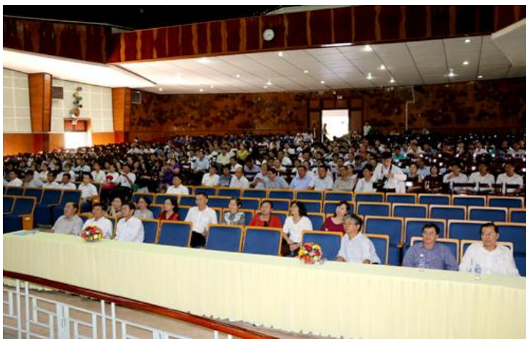
Họp mặt hội cựu sinh viên kỷ niệm 40 năm ngày thành lập ngành Chế biến - Công nghệ thực phẩm - ĐHCT