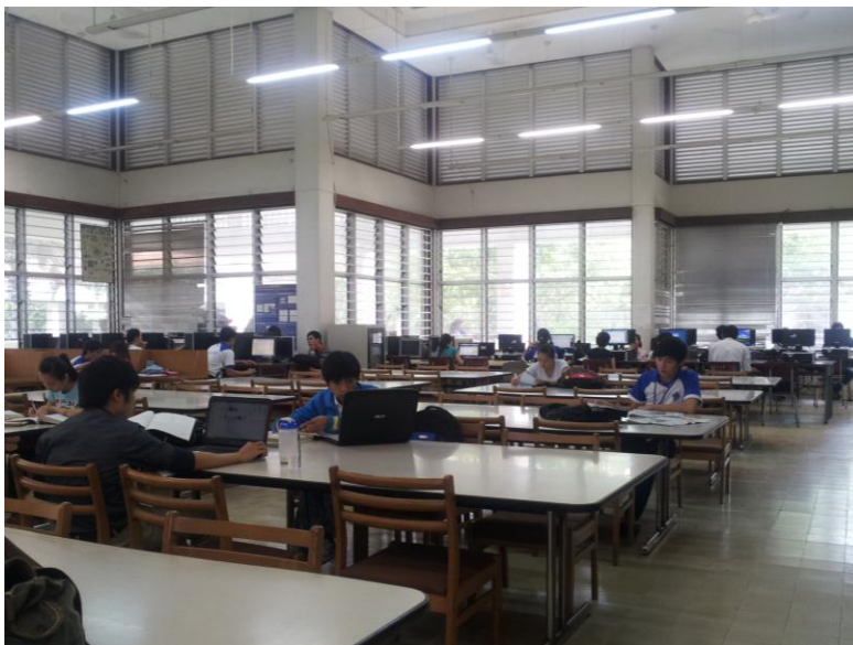
Một góc thư viện Khoa Nông Nghiệp

Thư viện có khoảng 40 máy tính nối mạng internet phục vụ cán bộ và sinh viên có nhu cầu khai thác thông tin và hỗ trợ khả năng tự học của sinh viên. Bạn đọc cũng có thể sử dụng chung nguồn cơ sở dữ liệu điện tử của Trung tâm học liệu Trường hiện có như: Blackwell Synergy, ProQuest Central, Hinari, Agora, dữ liệu tiếng Việt chuyên ngành, cùng các cơ sở dữ liệu trực tuyến (nguồn tài liệu mở). Thư viện Khoa Nông nghiệp phục vụ nhu cầu của đọc giả từ thứ hai đến thứ bảy hàng tuần.