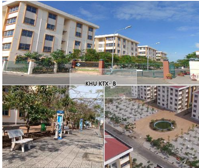
Kí túc xá Khu B - ĐHCT