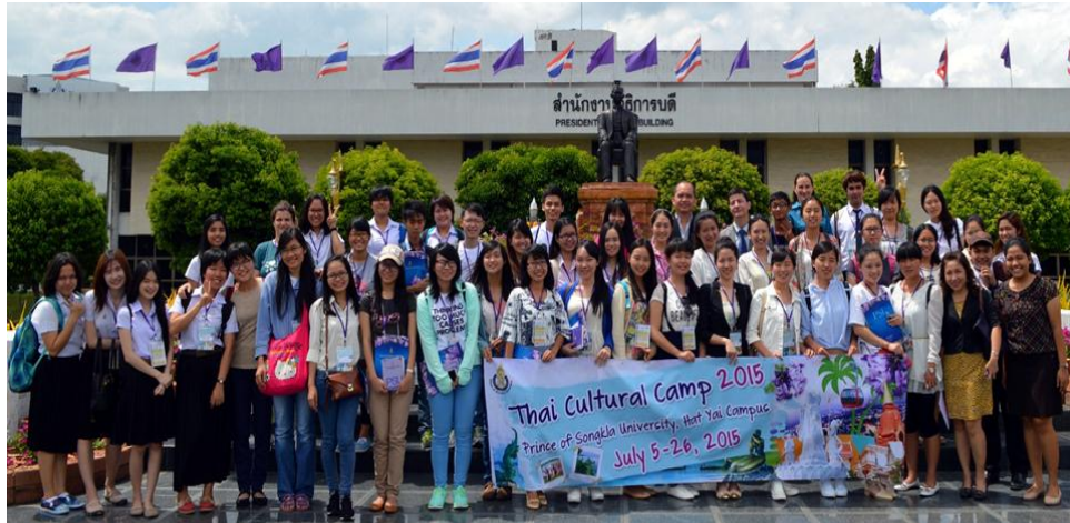
Sinh viên khối ASEAN+3 tham gia Hội trại giao lưu Văn hóa tại Thái Lan

Qua trải nghiệm chương trình Hội trại giúp các bạn sinh viên tham gia phát huy khả năng sinh hoạt tập thể, thuyết trình, hoạt động nhóm... Đồng thời, chương trình còn tạo điều kiện cho sinh viên các nước thể hiện bản sắc văn hoá dân tộc thông qua các tiết mục văn nghệ. Thông qua các hoạt động này sinh viên thuộc trường Đại học Cần Thơ cũng đã giới thiệu đến bạn bè quốc tế về đất nước Việt Nam nói chung và con người Việt Nam nói riêng.