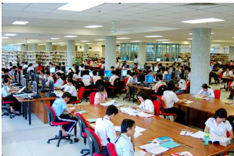
Một góc tại tầng 2 - Trung tâm học liệu ĐHTC

Trung tâm học liệu - Đại học Cần Thơ, tiền thân là Thư viện Trung tâm Đại học Cần Thơ được Tổ chức từ thiện Atlantic Philanthropies (Mỹ) tài trợ xây dựng trên diện tích đất 7.560 m 2 ngay lối vào cổng chính của khu 2 của Trường Đại học Cần Thơ. Trung tâm học liệu được xây dựng 4 tầng với tổng diện tích sử dụng là 7.560 m 2 . Trung tâm Học liệu được thiết kế xây dựng và sắp xếp mỗi tầng của tòa nhà rất hấp dẫn và khoa học phù hợp cho từng góc học tập, nghiên cứu, làm việc độc lập và theo nhóm. Đặc biệt là sự bố trí một cách khoa học dây chuyền hoạt động tổ chức, điều hành và phục vụ, tạo sự linh hoạt và dễ dàng cho sinh viên tại Trung tâm với website dễ dàng truy cập tại: https://lrc.ctu.edu.vn/