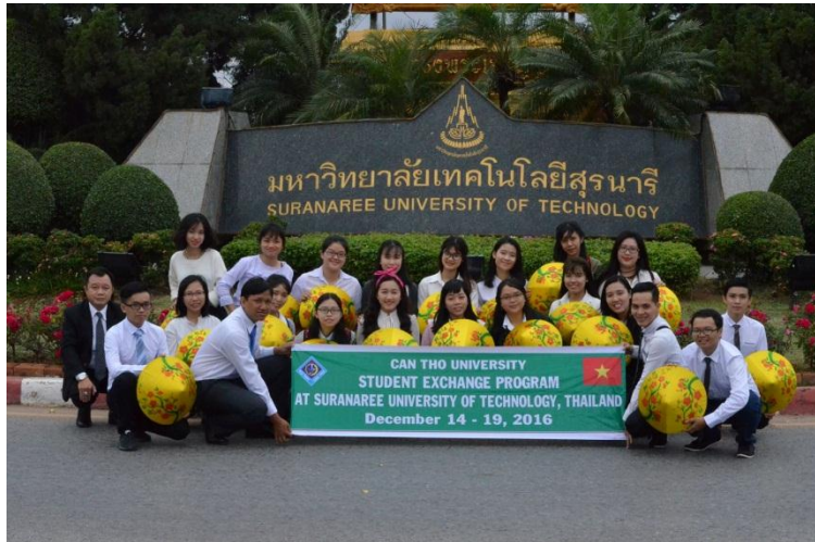
Trao đổi sinh viên tại Thái Lan

Đối với Trường ĐHTC, " Sinh viên là đối tượng phục vụ hàng đầu của Nhà trường ". Do đó, hàng năm, Trường dành ngân sách khoảng gần 2 tỷ đồng cho sinh viên đi giao lưu, học hỏi, học tập ngắn hạn ở nước ngoài nhằm tạo cơ hội cho sinh viên phát triển các kỹ năng, trước tiên là khả năng tiếng Anh, bên cạnh đó, giúp sinh viên cập nhật kiến thức, có thêm sự hiểu biết, đồng thời, xây dựng và phát triển các mối quan hệ tốt đẹp trong tương lai.