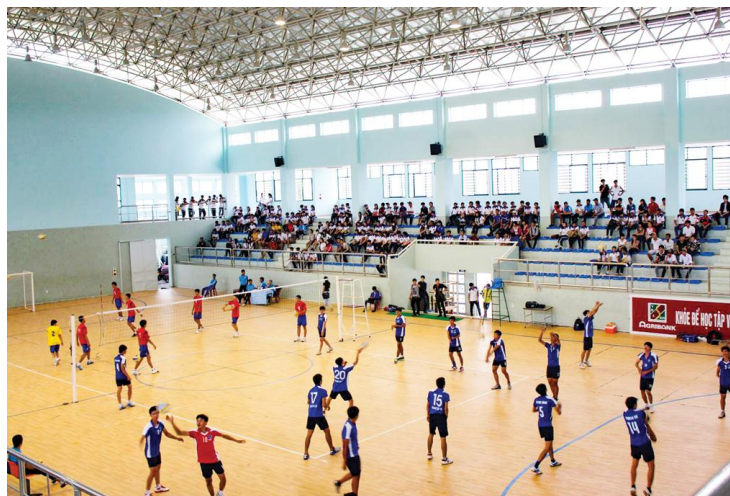
Nhà thi đấu - Thể dục thể thao Trường ĐHCT