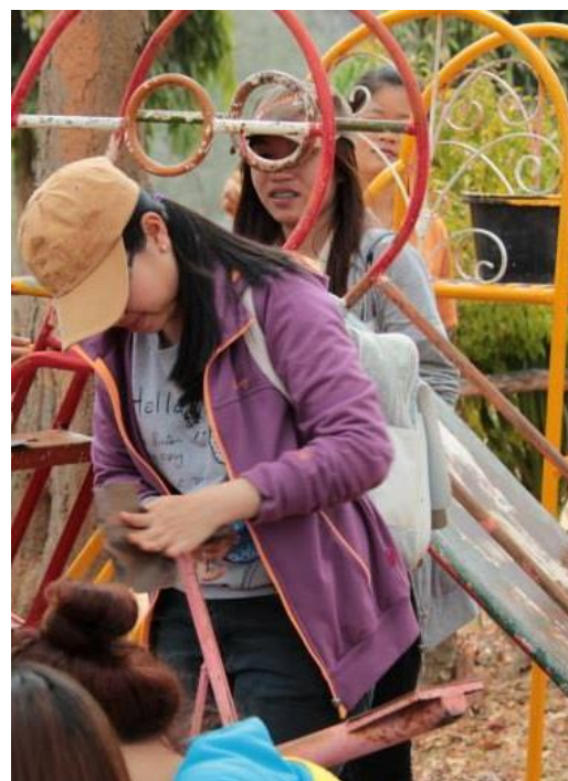
Trao tặng cặp sách mới và sơn lại xích đu cho các em

Có thể nói trong suốt 7 tháng qua, tôi đã có dịp tận hưởng nhiều điều bất ngờ hạnh phúc cũng như đối mặt với những khó khăn thử thách trong việc học tập, giao tiếp, văn