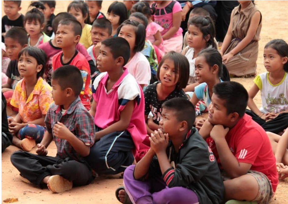
Trẻ em nghèo vùng núi phía Đông Bắc Thái Lan