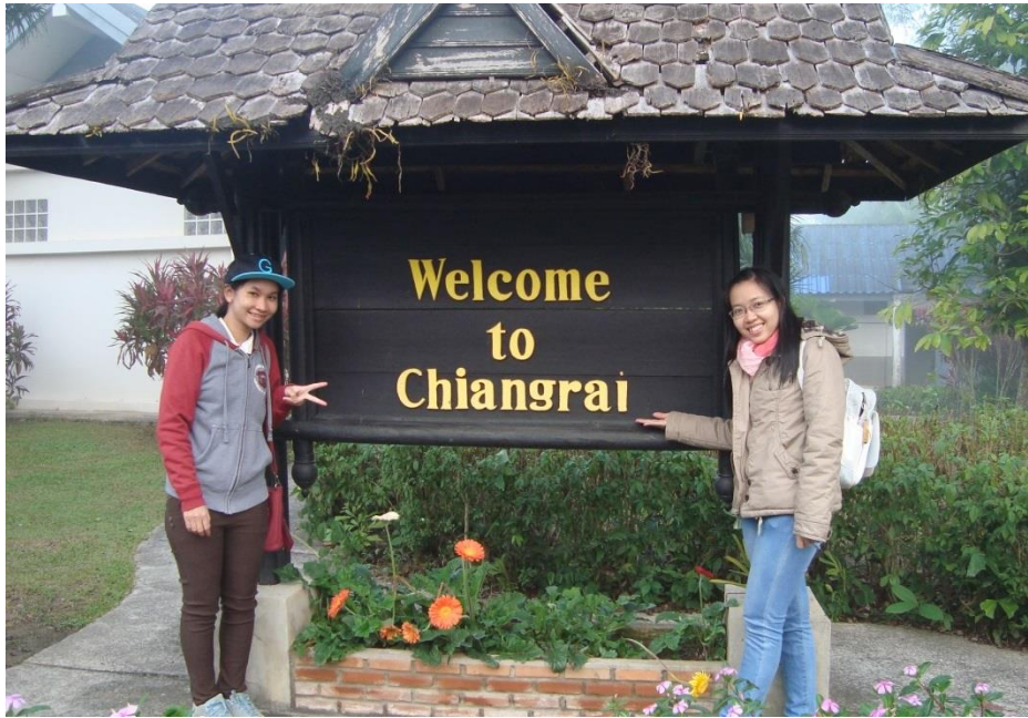
Thực tế cơ sở tại Chiangrai cùng Thầy Cô và sinh viên đại học

Ngoài ra, tôi còn có cơ hội tham quan du lịch một số tỉnh của Thái Lan như Nong Khai, Chiangrai và vùng núi phía Đông Bắc Thái Lan. Thông qua những chuyến đi, tôi không chỉ hiểu biết thêm về văn hóa, truyền thống và ngôn ngữ của đất nước này mà còn có dịp tham gia các hoạt động xã hội giúp đỡ người già và trẻ em nghèo vùng núi. Đây cũng là cơ hội giúp tôi rèn luyện khả năng giao tiếp tiếng Anh