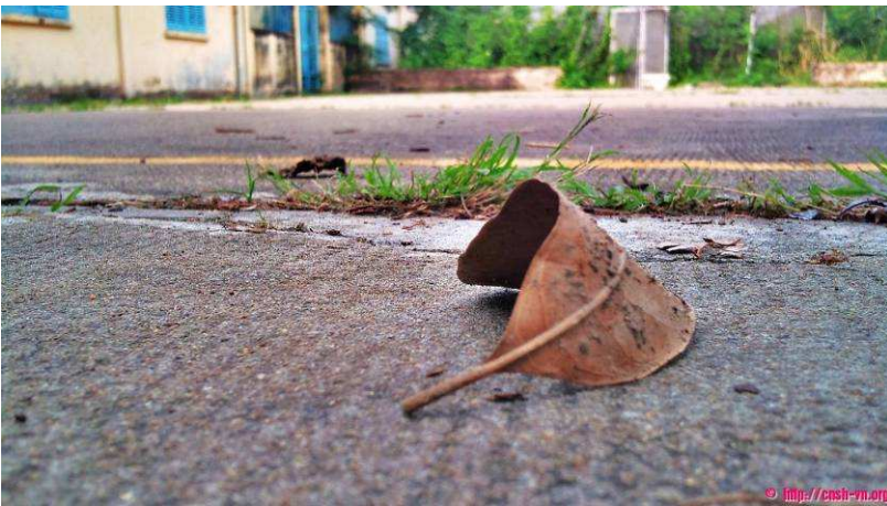
Tác phẩm: “Những Góc Tĩnh” Sinh viên: Dương Hạnh Vân